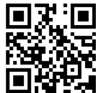
▲申込メールフォーム

パナソニック在籍中、非住宅分野における新規事業責任者として社内外で活躍し、現在は中小企業の経営支援を専門とするコンサルタントとして活躍。また各地商工会議所からのセミナー依頼も多数あり。「説明が分かりやすい」と参加者から毎回高い評価を得ている。